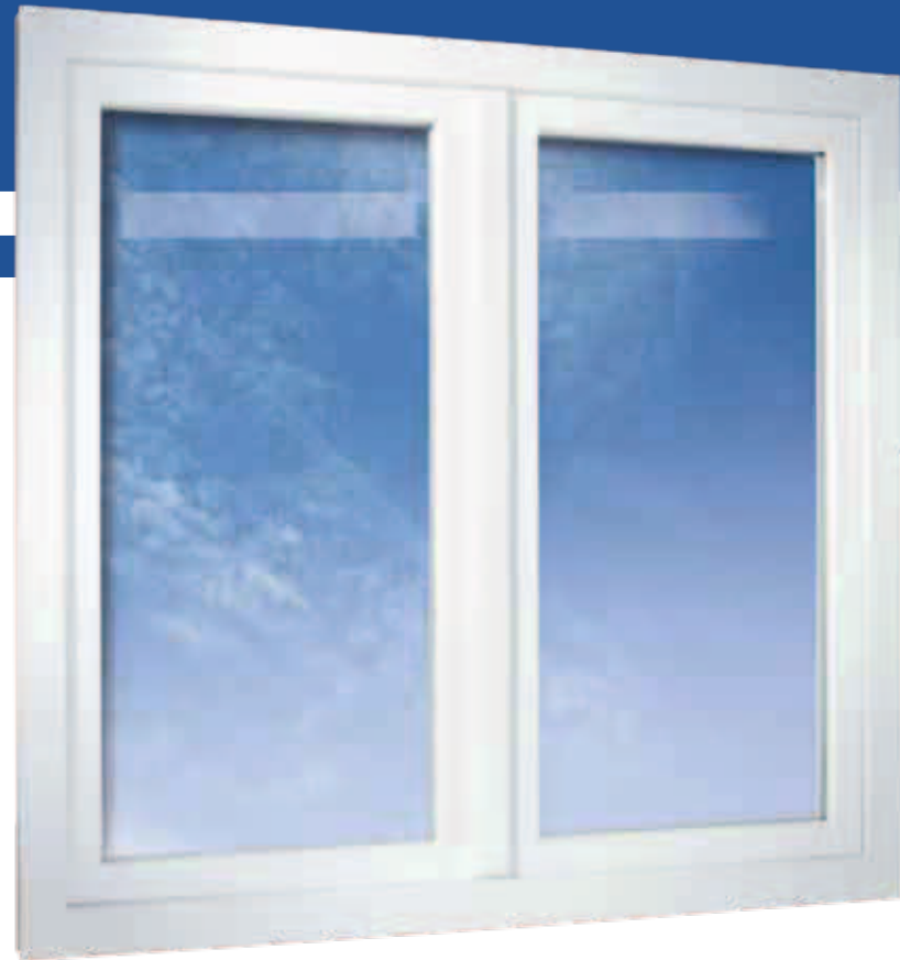
2-flügeliges Fenster in flächenversetzter Variante